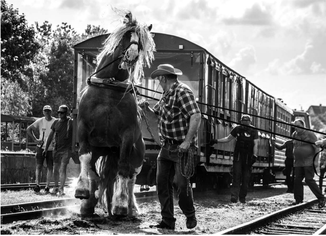
Siauruką traukiantys arkliai dalį visuomenės sukrėtė ir papiktino.

Viešojoje erdvėje nesiliaujant pasipiktinimui, kad prieš „Bėk bėk, žirgeli!“ šventę, tvyrant beveik 30 laipsnių karščiui, arkliai buvo verčiami traukti Siauruko traukinį su vagonais, tokią atrakciją organizavusi viešoji įstaiga „Aukštaitijos siaurasis geležinkelis“ išplatino pasiteisinimą.