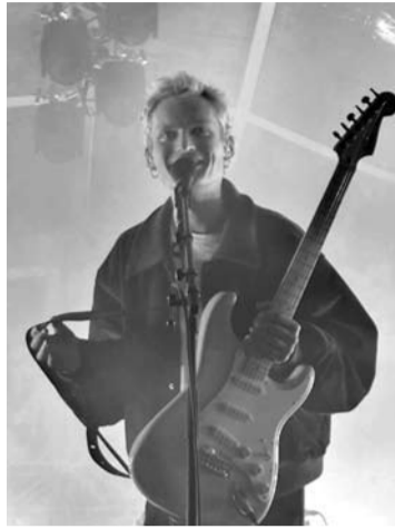
Grupė „ba.“ Troškūnuose užkūrė rimtą roko muzikos vakarėlį.

Koncertas buvo išskirtinis profesionaliu įgarsinimu bei apšvietimu. Bernardinų vienuolyno priegose buvo prekiaujama