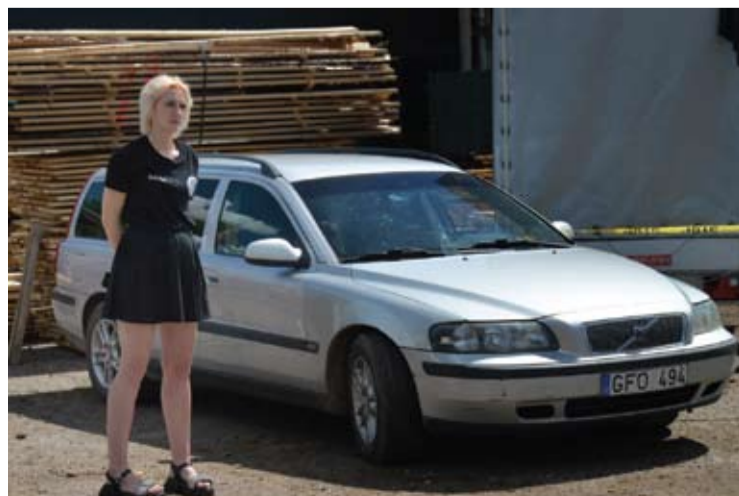
Renginio loterijoje buvo galima laimėti tokį automobilį.